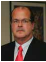
Weber Porto Präsident der AHK Brasilien